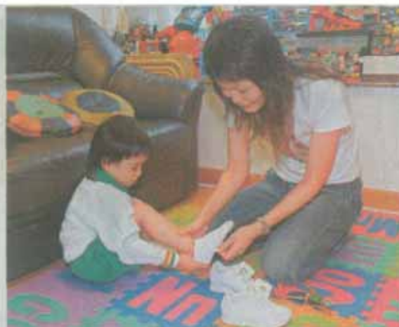
■在幼兒中心上課短短兩月，若谷的自願能力明顯增強，例如他學懂穿和脫襪子。

「由最初上課兩天，有父母陪伴在側，到現在五天上課，要自己面對，孩子未必能一下子接受，面對變化按部就班較易接受。從Playgroup到幼兒中心，谷谷的確成長不少，他不但有機會學習與人溝通，多了同學仔做朋友；自理能力亦提升，例如懂得穿和脫襪子；加上學校訓練大小肌肉，他的雙腿發展不俗，上下樓梯活動自如。」